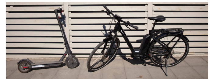
Tilraunir með rafhjól og rafskútur fyrir vinnuferðir ganga vel.