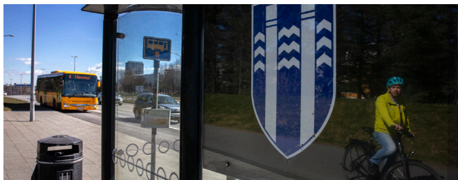
Samgönguátak Strætó og Landspítala um árskort 29.500 kr heldur áfram.