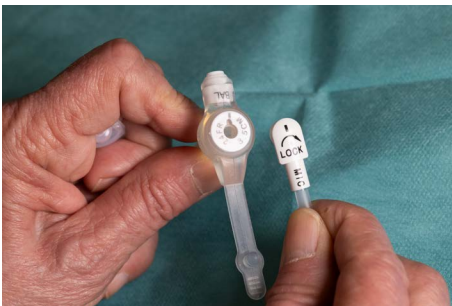
Mynd 3. Millislanga fest á næringarhnapp

Þegar millislangan er fest á næringarhnappinn, er strik á millislöngunni sett inn hjá striki á næringarhnappi, millislöngu ýtt inn í hnappinn og snúið réttisælis (sjá mynd 3). Þá er millislangan föst og hægt að tengja næringarsett við. Þegar fjarlægja á millislönguna eru strikin aftur látin standast á og millislöngunni kippt úr hnappnum.