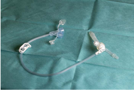
Mynd 2. Millislanga

Þegar millislangan er fest á næringarhnappinn, er strik á millislöngunni sett inn hjá striki á næringarhnappi, millislöngu ýtt inn í hnappinn og snúið réttisælis (sjá mynd 3). Þá er millislangan föst og hægt að tengja næringarsett við. Þegar fjarlægja á millislönguna eru strikin aftur látin standast á og millislöngunni kippt úr hnappnum.