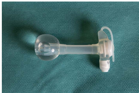
Mynd 1. Næringarhnappur