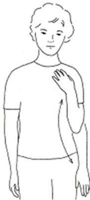
Mynd 2. Beygt og rétt úr olnboga