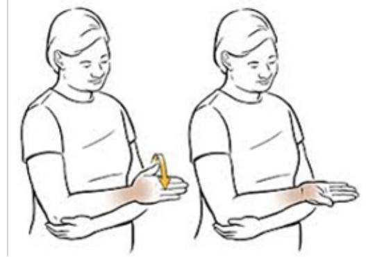
Mynd 3. Lófa snúið