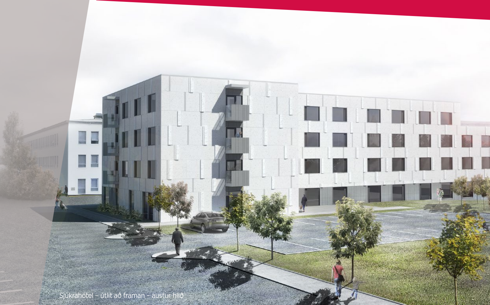
Sjúkrahótel – útlit að framan – austur hlið