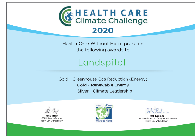
Landspítali hlaut loftslagsviðurkenningu Health Care without Harm, Climate Challenge Award fyrir að draga úr losun gróðurhúsalofttegunda, hlutdeild endurnýjanlegrar orku og að vera leiðandi á þessu sviði.