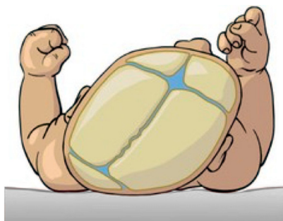
Óeðlileg og skökk höfuðkúpa

Höfuðkúpa ungbarna er mjúk og mótanleg. Liggi barn oftast með höfuð snúið til sömu hliðar verður höfuðkúpan flatari þeim megin og önnur bein höfuðkúpu skekkjast einnig.