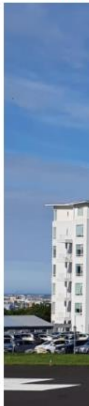
Landspítali in Fossi