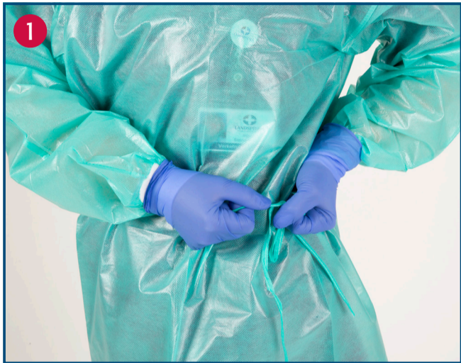
Slitið bandið á sloppnum

Einangrun sjúklings með grun um eða staðfestan COVID-19