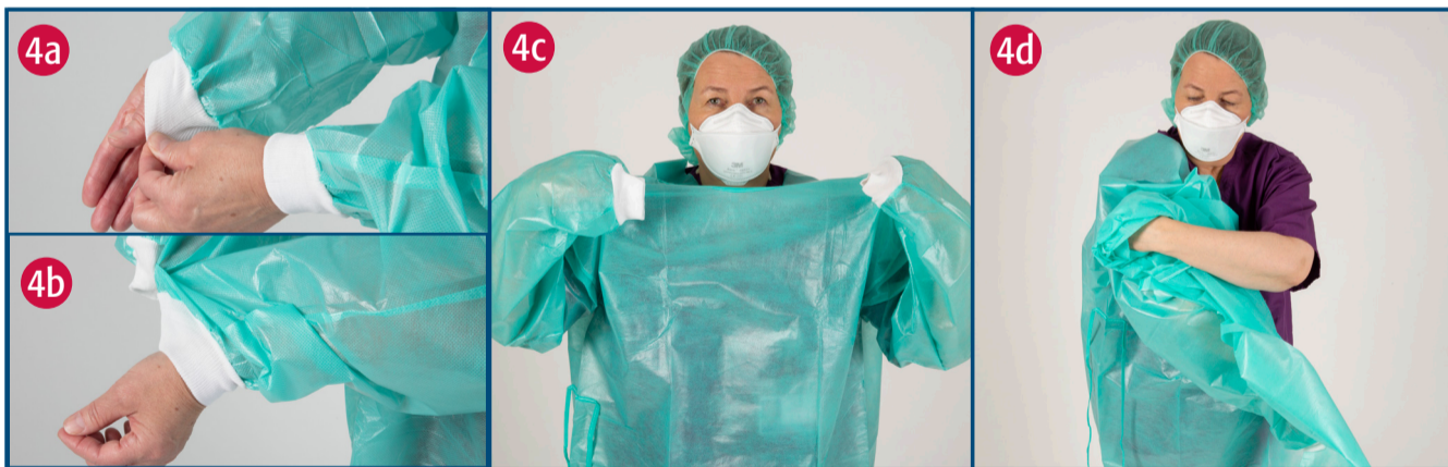
Farið úr hlífðarsloppi

3a) Takið í teygjurnar við gagnaugu. 3b) Dragið gleraugun beint fram og síðan upp og af. 3c) Sprittið hendur.