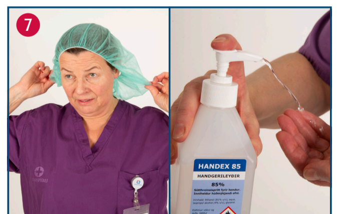
Takið húfuna af og sprittið hendur

6a) Fjarlægjð finagnagrímu. 6b) Takið í neðri teygju að aftan og lyftið yfir höfuð. 6c) Takið í efri teygju að aftan og lyftið yfir höfuð. 6d) Haldið með annarri hendi í efri teygjuna og hendið grímunni. 6e) Sprittið hendur.