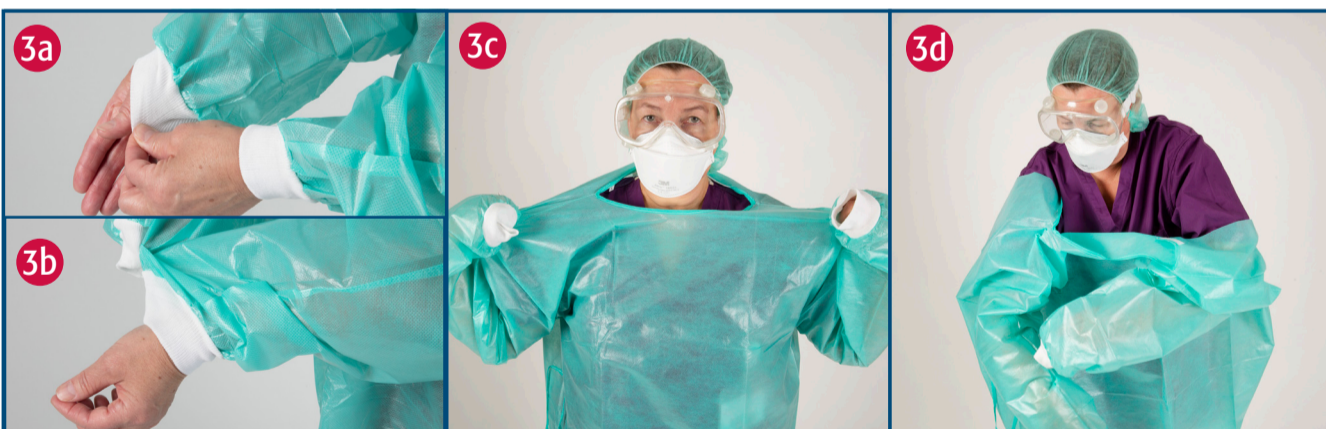
Farið úr hlífðarsloppi

2a) Tekið er í fyrri hanskan utanvert ofarlega. 2b) Hanskinn er dreginn af hendi og snúið við í leiðinni. 2c) Hanskinn er geymdur í hansaklæddu hendinni. 2d) Farið er með finger innanvert í seinni hanskan. 2e) Hanskinn er dreginn af þannig að hann hvolfist yfir hanskan sem haldið er á. 2f) Sprittið hendur.